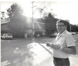
30 anos à frente do Museu Lasar Segall Textos de Mauricio Segall

Esta publicação reúne textos de diferentes naturezas – propostas teóricas, discursos, introduções e ensaios para catálogos de exposições, análises para revistas especializadas – produzidos por Maurício Segall, filho do artista lituano Lasar Segall, ao longo de trinta anos de exercício museológico no Museu Lasar Segall.