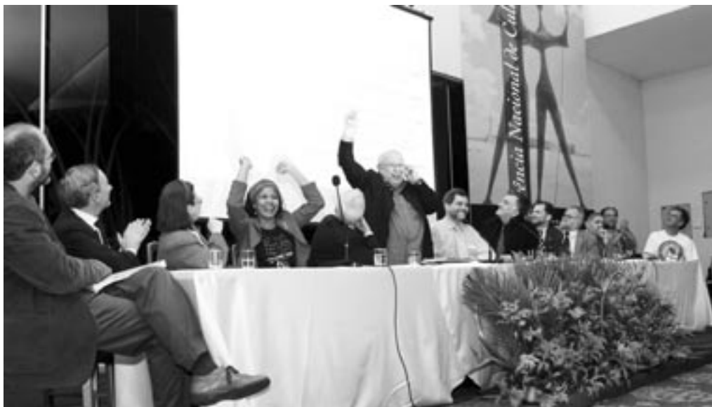
Mesa da Conferência Nacional de Cultura

pessoas de mais de 1.100 municípios brasileiros realizaram encontros municipais, estaduais e regionais que resultaram na 1ª Conferência Nacional de Cultura (1ª CNC), realizada em dezembro de 2005. Delegados, observadores e convidados de todo o país debateram as propostas provenientes das conferências estaduais e do Distrito Federal, antecedidas pelas conferências municipais e intermunicipais e pelos seminários setoriais de cultura, com destaque para a participação de profissionais da área de museologia. A 1ª CNC contou com 1.356 participantes, 823 delegados, 338 convidados e 60 observadores. A criação de órgãos gestores e de conselhos de cultura entraram na agenda de vários municípios e estados. É importante sublinhar que a 1ª CNC norteará a realização do Plano Nacional de Cultura, incluindo a área de museus.